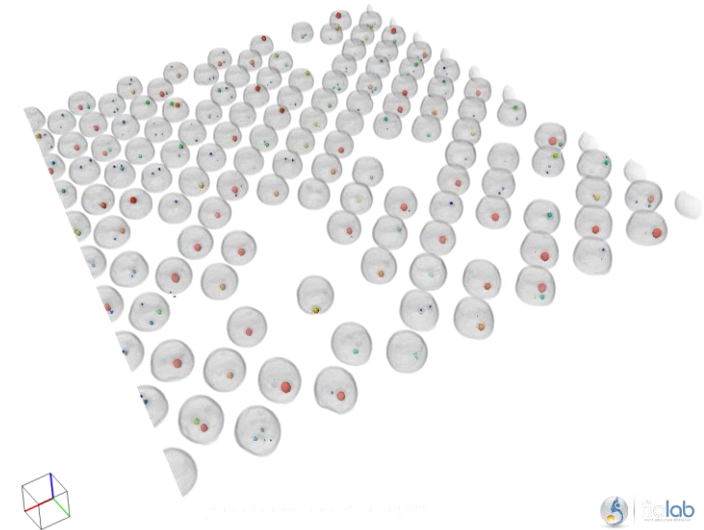
Représentation 3D des billes et des voids internes